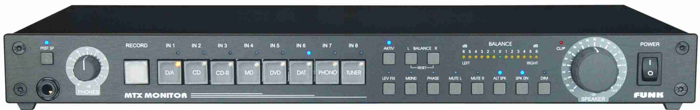
MTX-MONITOR.V3b-1, versione HiFi nera