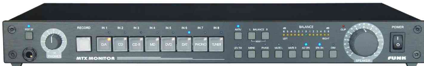
MTX-MONITOR V3b-4.2.1, HiFi-Version schwarz